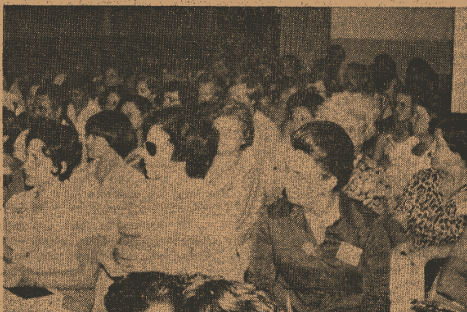
Mais de 150 pessoas concorreram à Reunião Regional da Grande São Paulo.

Clube do Livro, a cargo do Centro Espírita Aprendizês do Evangelho, de São Paulo; Editorial, idem; Mocidades, idem; Infância, idem; Integração, Grupo Socorrista Maria de Nazaré; Interior, Grupo Socorrista Irmão Alfredo; Grande São