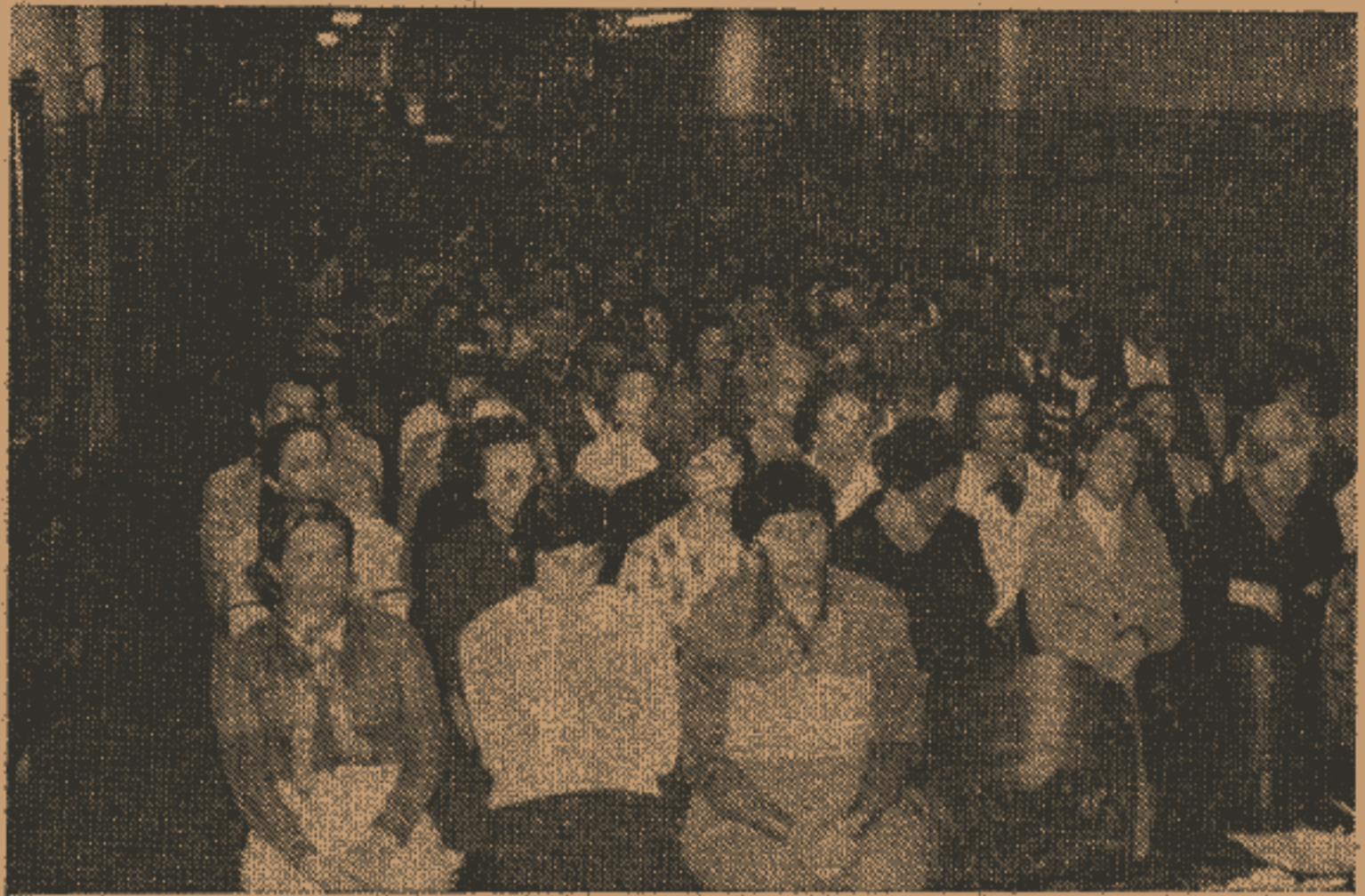
123 discípulos lotaram o auditório

E, aqueles que estão parados, que façam a si uma indagação: "como comparecerei diante dos mentores espirituais quando eu regressar à Pátria Espiritual"? Se perceberem que comparecerão de mãos vazias, que comecem hoje a preencher suas vidas com alguma atividade na seara do Mestre. Mãos vazias para o discípulo, significam vazio do espírito, estagnação. E