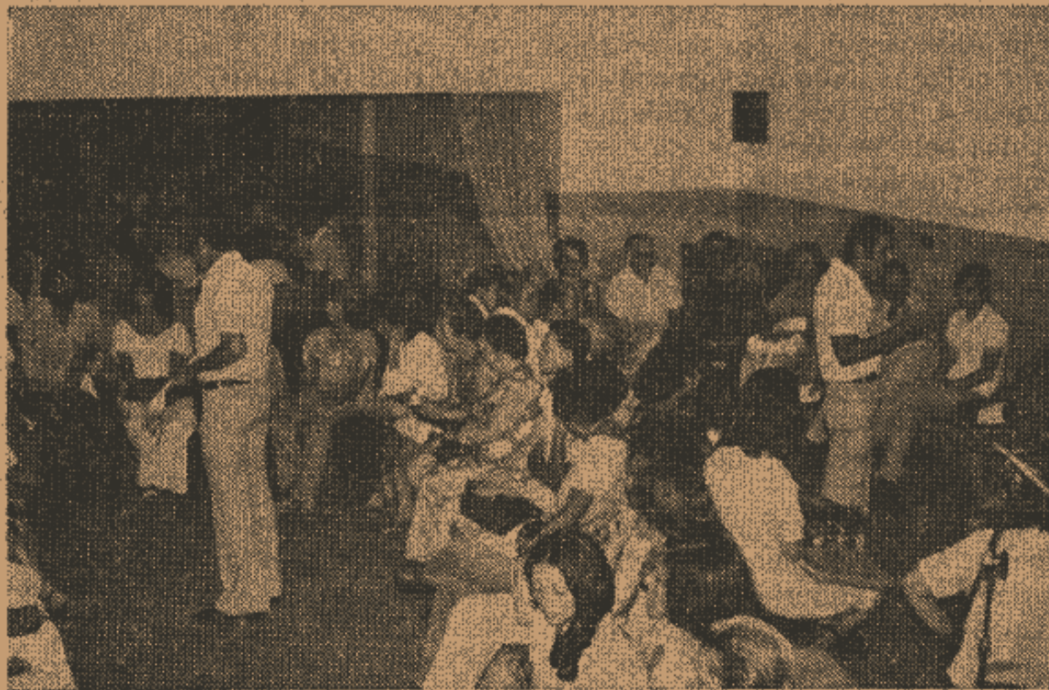
O que se espera da coordenação da FDJ? Foi o tema dos debates em grupo.