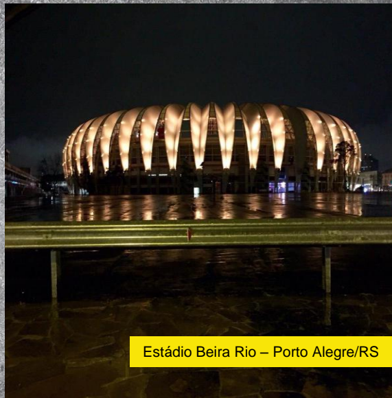
Estádio Beira Rio – Porto Alegre/RS