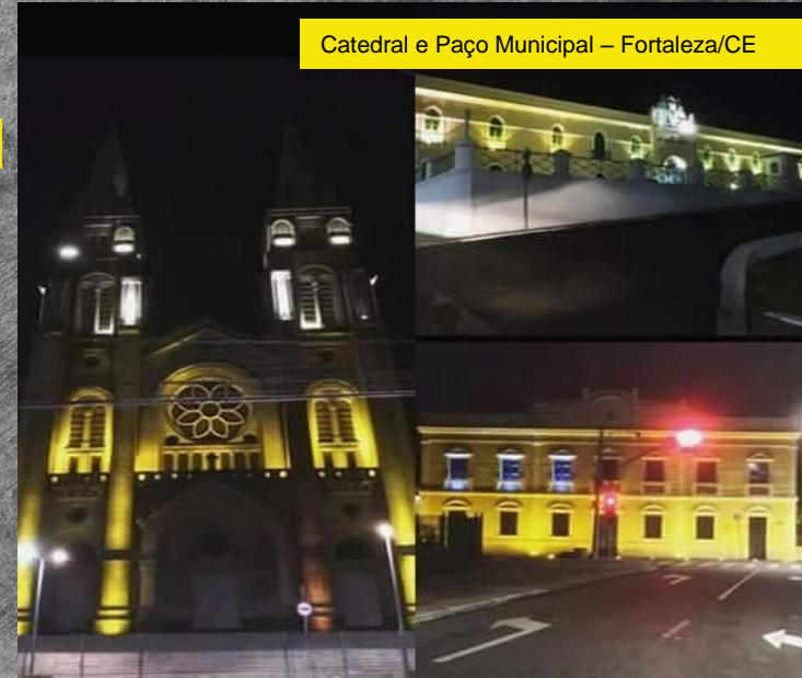
Catedral e Paço Municipal – Fortaleza/CE