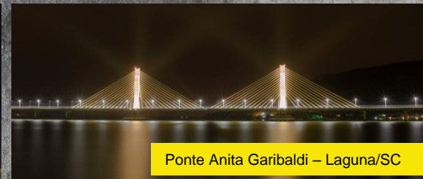
Ponte Anita Garibaldi – Laguna/SC