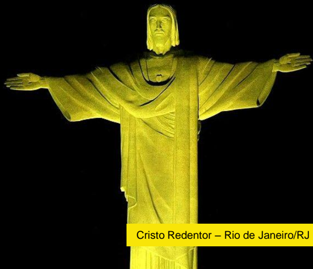
Cristo Redentor – Rio de Janeiro/RJ