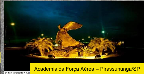
Academia da Força Aérea – Pirassununga/SP