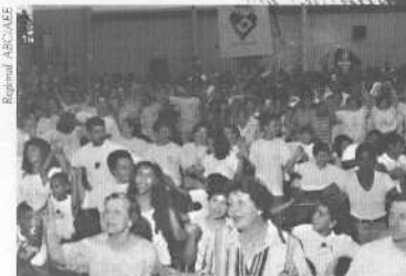
O encontro no ABC: ginsdio repleto