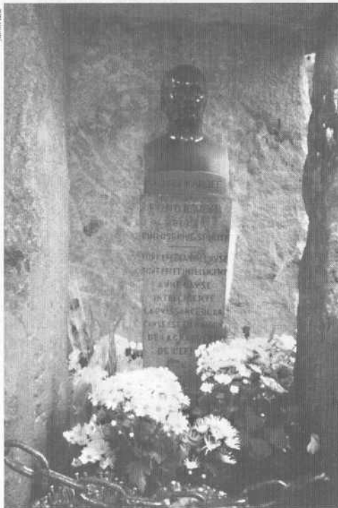
Túmulo de Kardec em Paris.

Que é preciso cristianizar a Humanidade é afirmação que não padece dúvida, entretanto, cristianizar, na Doutrina Espírita, é raciocinar com a verdade e construir com o bem de todos, para que, em nome de Jesus, não venhamos a fazer sobre a Terra mais um sistema de fanatismo e de negação.