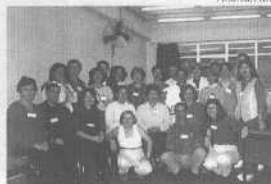
Participantes do módulo sobre EAE por Correspondência na Reciclagem na Federação