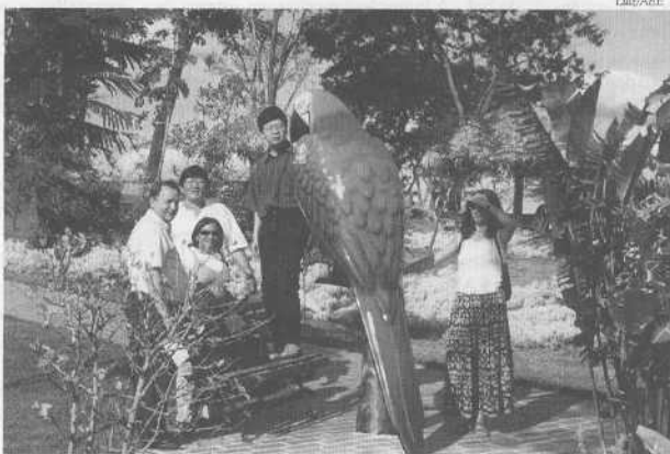
Integrantes da diretoria da Aliança com participantes da Regional Centro-Oeste