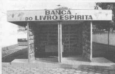
C.E. Santo Agostinho/AEE

(Discurso proferido na inauguração da Banca do Livro Espírita em Itajobi, mantida pelo Centro Espírita Santo Agostinho desde 7 de setembro de 1996 ao lado da Estação Rodoviária, com um acervo sempre em torno de 450 títulos. Nestes dois anos e meio de funcionamento, atingiu a marca de 930 livros vendidos, o que, para uma cidade do porte de Itajobi, se constitui em uma grande vitória, considerando os participantes do Grupo. O discurso foi publicado originalmente no jornal "Trombeta" de 14 de setembro de 1996)