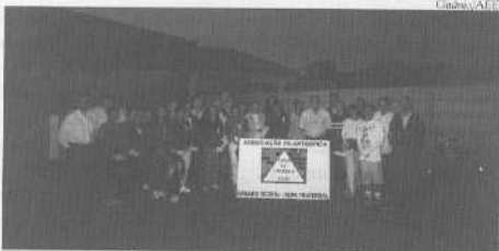
À noite, a inauguração da Casa do Caminho em Araraquara

Após três anos de trabalho, o CEAE Araraquara inaugurou na tarde de 15 de maio seu primeiro "filhote", a sede da Associação Filantrópica Ca-