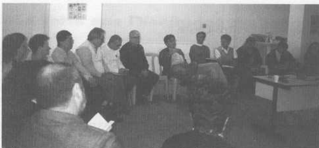
Após a exibição da fita, integrantes do Conselho da Aliança analisam o trabalho

Aproveitando a ocasião, conselheiros comentaram sobre a oportunidade de um trabalho sobre a apostila "Cromoterapia". Ficou acertado que o Conselho está aberto a que voluntários tomem a iniciativa de assumir um estudo aprofundado sobre o assunto.