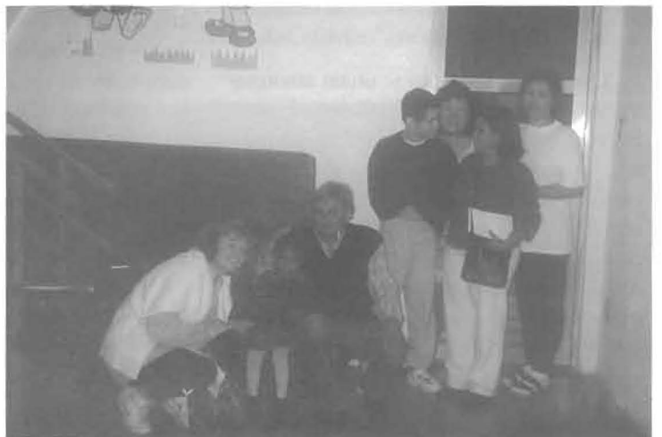
O dia se completou com a ida ao C.E. Caminho da Redenção, na Mooca, Grupo que mantém o Lar da Redenção, atualmente com 11 crianças excepcionais.