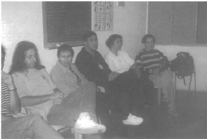
No dia seguinte, no C.E. Luz e Amor, de Guarulhos.