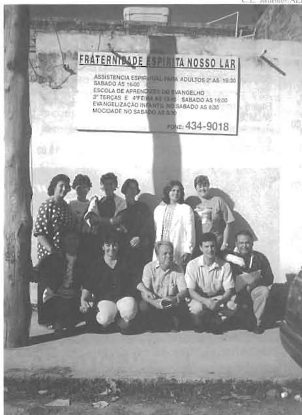
C.E. Redentor em visita a Belo Horizonte