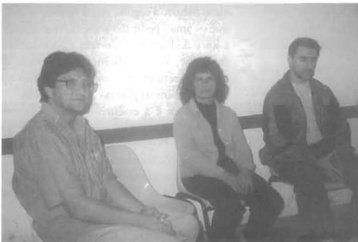
Na mesma data, também foi visitado o C.E. Caminho da Luz, da Vila Medeiros, onde Ana ressaltou "o comprometimento com o movimento de Aliança".