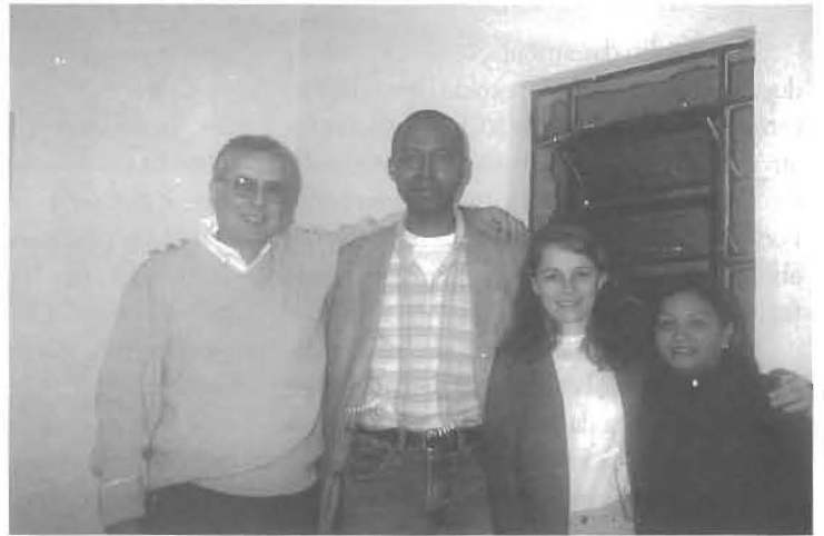
No dia 17, a visita ocorreu no Centro Espírita Mensageiros da Paz e da Esperança, no bairro de Pinheiros.