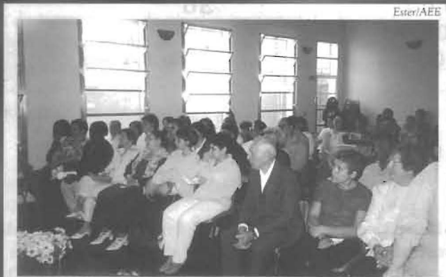
Passagem para a Fraternidade na Setorial Norte

“Os Exilados da Capela”, de Armond, sai em italiano