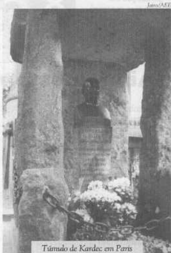
Túmulo de Kardec em Paris

Os pais devem firmar um incessante combate às ervas daninhas das imperfeições, plantando as boas sementes das virtudes no coração dos filhos, para que elas germinem hoje ou no futuro, abrindo a esses Espíritos a porta da renovação e do aperfeiçoamento espiritual. Missão essa da qual não podem fugir ou se furtar às consequências de sua negligên-