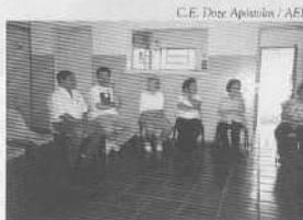
C.E. Doze Apóstolos / AEE

A Casa Espírita Doze Apóstolos, de Santo André (SP), relatou visitas realizadas em setembro. Representando o Conselho de Grupos Integrados, esteve no C. E. Aprendizes do Evangelho – Casa Verde, zona norte paulistana, em 16 de setembro. Entre outros assuntos, de ordem administrativa e relacionados a cursos, foi destacada atividade social, junto a crianças e jovens da Febem