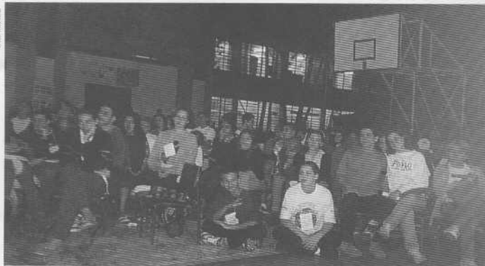
Plerário do sábado à noite (acima) contou com o Programa "Livre Arbtrio" (abaixo)