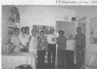
F.E. Missionários da Luz / AEE

A Casa de Santo André comunica que em 10 de setembro houve muita confraternização na visita à Casa Espírita Amor e Luz (foto), de São Pedro (SP). A troca de experiências foi muito proveitosa.