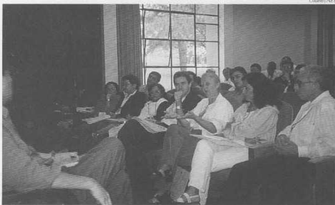
Reunião dos Coordenadores da FDJ

Ingresso - Foi retomada a deliberação da véspera, de que os ingressos na FDJ não contem exclusivamente com alunos de uma única Casa. Não podem ser confundidos com "formaturas". A cerimônia privativa integra um conjunto, que começa na disposição do aluno em ingressar, passa pela avaliação da Caderneta Pessoal e pelo exame espiritual. Foi retomada a proposta da Regional ABC, de patrocínio, pela Regional mais numerosa,