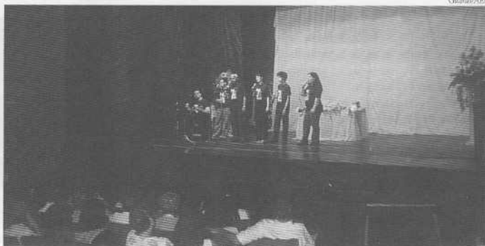
Apresentação do Grupo Harpas Eternas