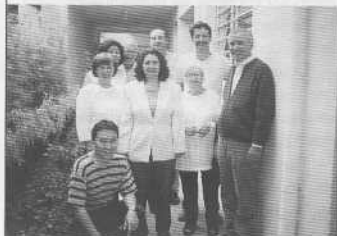
C.E. Discípulo de Jesus/AEE

CEAE Brusque – Em visita que coincidiu com reunião da Setorial Centro da Regional São Paulo Capital, em 27 de maio, um dos assuntos tratados foi a celebração dos 50 anos da Escola de Aprendizes do Evangelho, que havia ocorrido 20 dias antes.