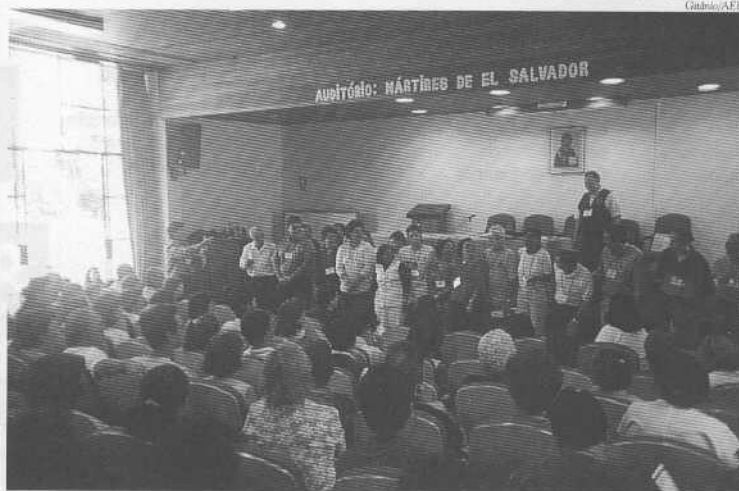
Na plenária de encerramento, coordenadores regionais e setoriais são "apresentados"