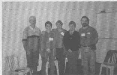
Regional Litoral Sul / ABE

Fundado há nove anos, está atualmente na 7ª Turma de Escola de Aprendiz do Evangelho (foto). Um relato interessante: implantação da Pré-Mocidade.