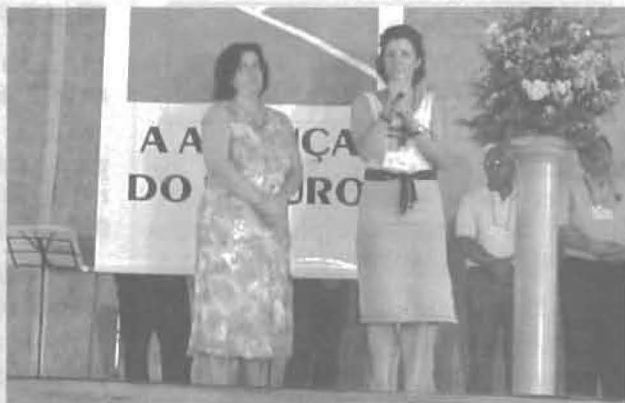
Apresentação da Regional na abertura

Que a Aliança do futuro nos permita sonhar com um mundo onde haja muita paz e fraternidade no coração de todos os homens.