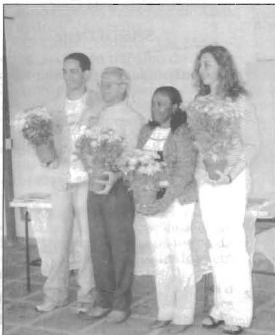
Galuzzi - 5ª turma do FEVM - Santos.

Na mensagem do Plano Espiritual, o convite à testemunhação e a necessidade do sacrifício para auxiliar o maior número de pessoas possíveis neste momento em que a Terra passa por grandes mudanças.