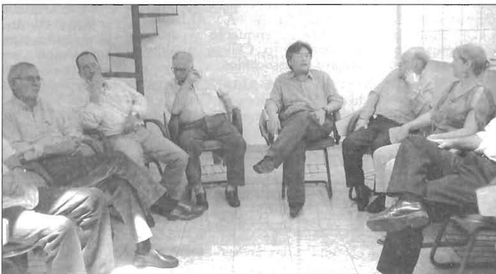
Painel realizado com companheiros que colaboraram na criação e consolidação da AEE

como o rádio foi um instrumento importante para divulgação e, principalmente, para preparação das novas lideranças do Movimento. Meses de trabalho foram empenhados na veiculação do programa "Encontro Espírita", em que um roteiro de estudo doutrinário e divulgação de frentes de trabalho cristão foi ao ar pelos transmissores