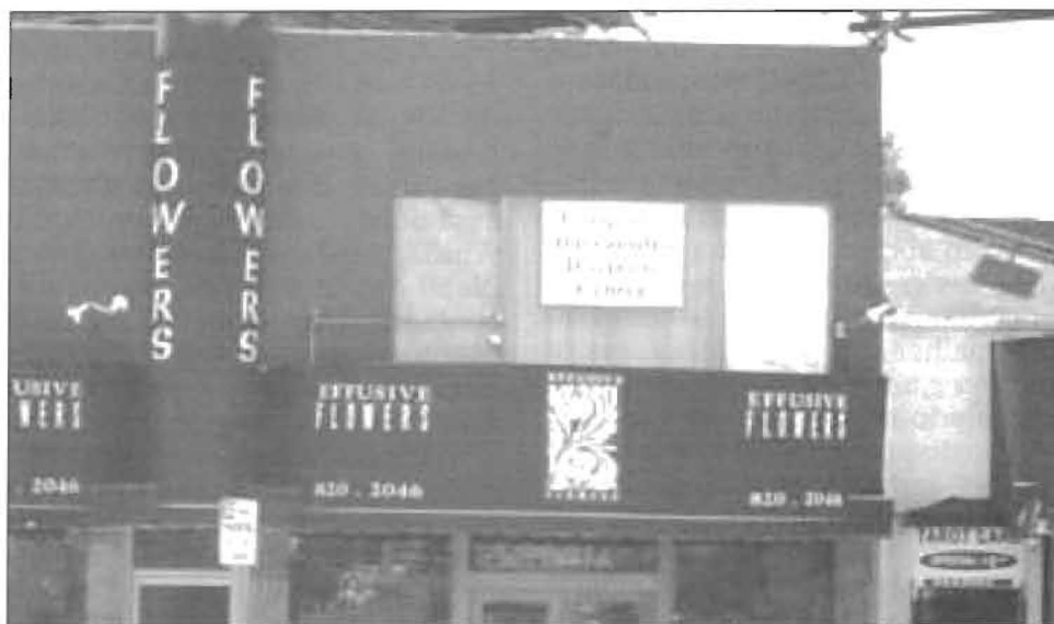
Fachada do C.E. Eurípedes Barsanulfo em Los Angeles (EUA)

O segundo Centro que visitei foi o Blossom Spirit Center. Em português, blossom significa desabrochar. A Casa fica na Grande Los Angeles, um pouco afastada da cidade,