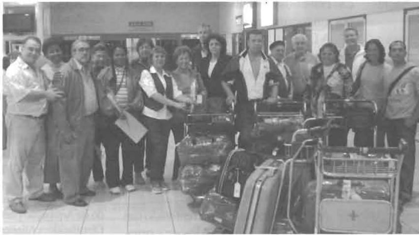
A Caravana Global da Aliança recebeu calorosa assistência, em seu trabalho de 12 dias em Cuba. Foram 2.200 km percorridos em visitas a 8 localidades.