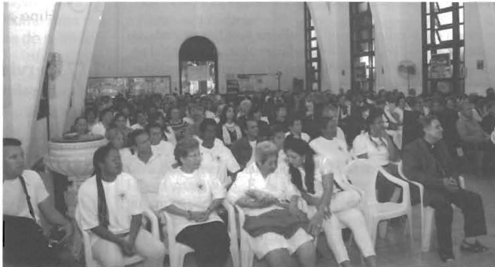
“Mais de 200 pessoas assistiram à exposição sobre os programas da Aliança, em reunião realizada na Catedral de La Santíssima Trinidad de Habana.”

Como decorrência dessa apresentação, diversas entidades manifestaram interesse na realização de futuros eventos conjuntos, inclusive com a possibilidade de estabelecerem contatos com o CVV – Centro de Valorização da Vida