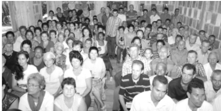
Sociedad Em Pos de la Verdad, San Pablo de Yao (Bayamo)

À tarde, os caravaneiros deveriam sair às 14h30 para Camaguey, mas, devido aos trâmites para o aluguel dos carros que os condu-