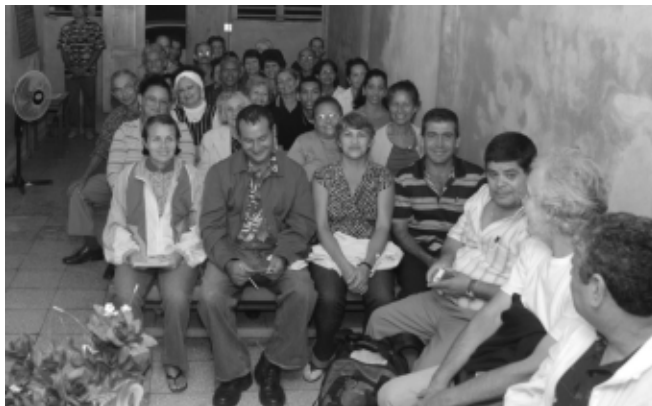
Sociedad Espírita Allan Kardec, Holguin

Além dos carros que conduziam os caravaneiros, seguiu também um ônibus com pessoas de Bayamo e os membros da SKSLA de La Habana. Os participantes do local se deslocaram a pé, durante horas, para participar desta reunião. Às 14h, o grupo seguiu para Guisa, ainda na Província de Bayamo, para conhecer ativida-