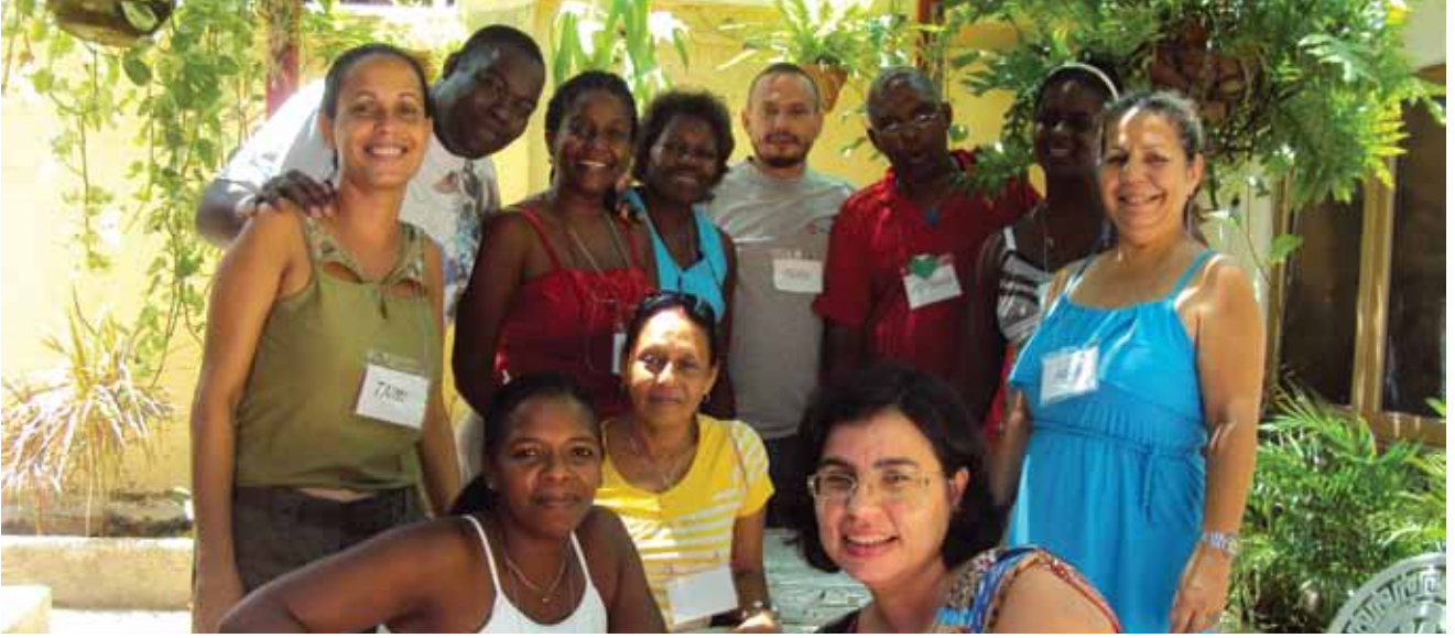
Curso de Evangelização Infantil no "Verdad, Amor y Luz" - Cuba set/2011