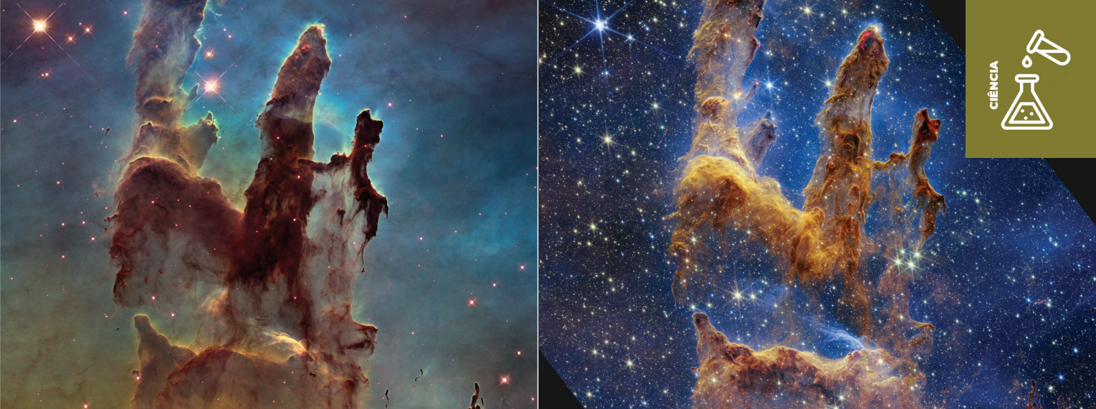
Registro da nebulosa Águia pelos telescópios Hubble (esquerda) e James Webb (direita).