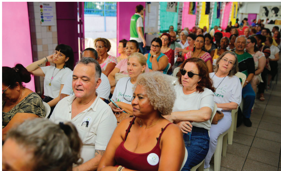
fotos: Comemoração de 50 anos da Aliança em 2 de dezembro, São Paulo.