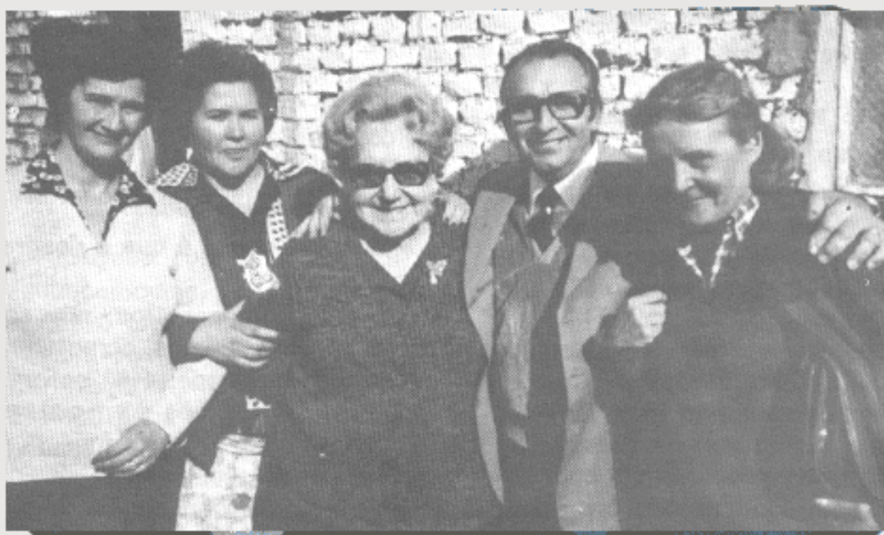
Irmãos do Amalia Domingo Soler, de Mar Del Plata, e do Centro Doncella de Orleans, de Miramar.

Así como Él, también vosotros seréis mal interpretados, no sabréis ser comprendidos, y así os encontraréis entonces luchando firmemente, pero siempre buscando esa maravillosa sîembra de amor. Este maravilloso contrato que habéis firmado, está escrito en lo Alto. Este momento que vosotros vivís, no lo olvidéis nunca. Estos propósitos que, en cada uno de vosotros, se hacen en estos momentos, tratad que se hagan sangre y carne en vosotros mismos. Cuando vayáis a caer y cuando queráis caer nuevamente en el error, recordad este maravilloso día; recordad esta fecha, estos momentos, y entonces, nuevamente, tomaréis fuerzas. Recordad todo el transcurso de vuestra Escuela de Evangelio, todo lo que vosotros aspirábais hacer y trabajar. Trabajar constantemente, pues que así no seréis vosotros sólo los que podáis así trabajar, sino para que se acerquen muchos más hasta aquí, y así hacer lo mismo que hiciste vosotros. La tierra, queridos hermanos, necesita de muchos sembradores. La tierra, en estos momentos, que se encuentra confundida, envuelta en el materia-