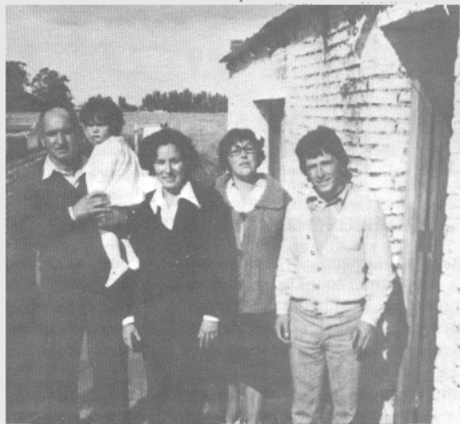
Representantes do Grupo de Tornquist presentes à reunião de Loberia.