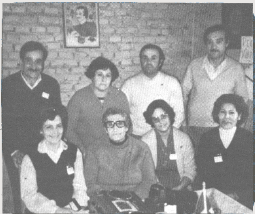
Discípulos de Loberia que ingressaram na FDJ em 3 de maio.