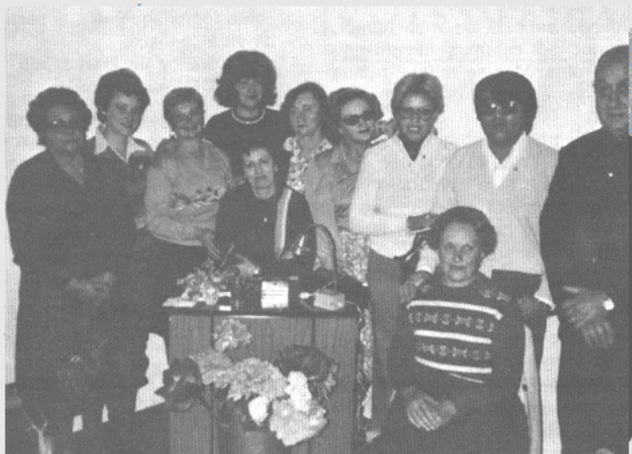
Discípulos de Mar Del Plata que ingressaram na FDJ em 2 de maio.