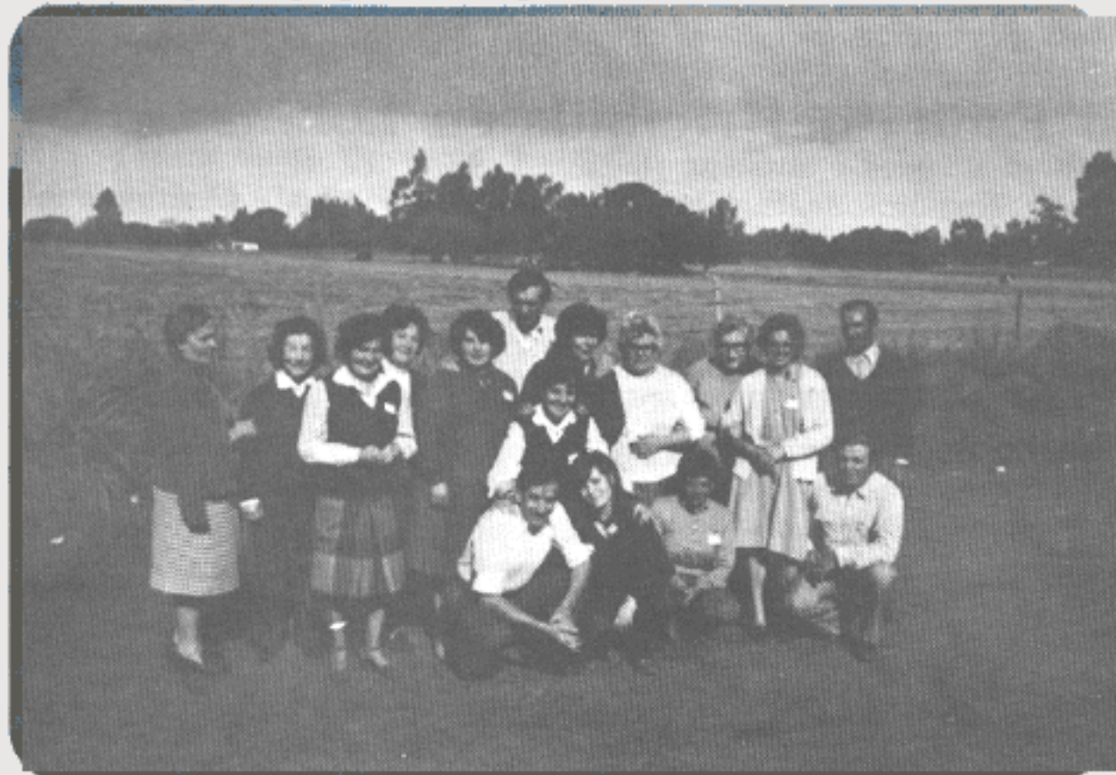
O grupo de trabalhadores espíritas de Loberia. Há quatro anos eram menos de cinco pessoas.

As fotos desta página falam da alegria e da simplicidade dos companheiros argentinos.