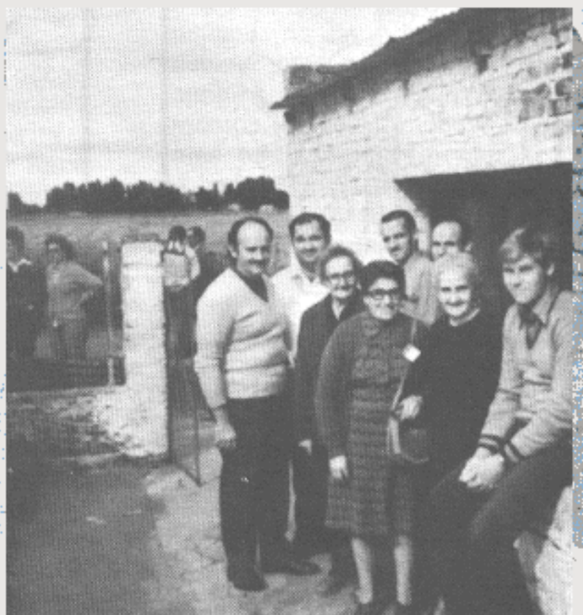
Companheiros de Necochea presentes ao encontro de Loberia.