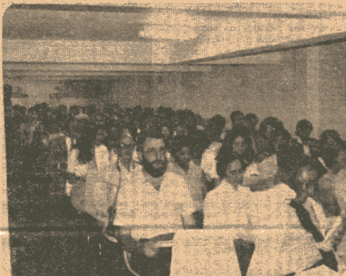
Aspecto da sessão de abertura da Reunião Nacional da AEE, dia 12 de dezembro