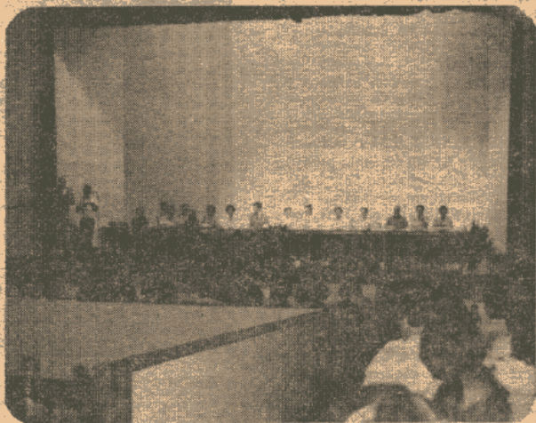
Momento de êxtase: dirigentes e novos Discípulos em reunião privativa no dia 14 de dezembro.

Para 1981, a FDJ continuará desenvolvendo reuniões regionais, de confraternização entre discípulos de uma mesma região, mas,