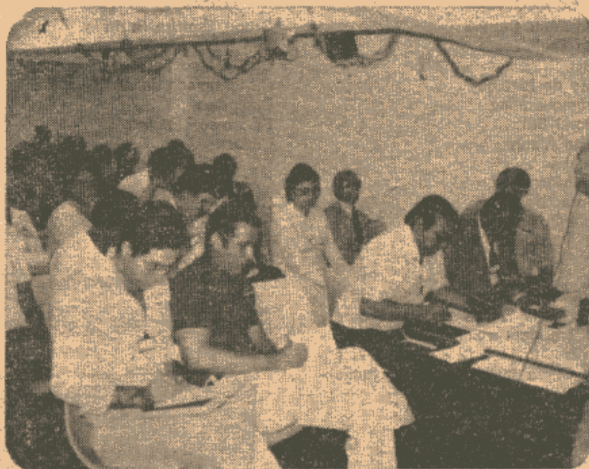
Na AGI do dia 13: surge um Clube do Livro já com 3.000 sócios